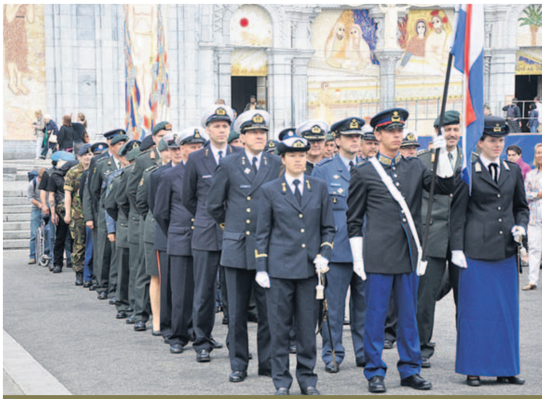
Bij de militaire bedevaartgangers in Lourdes vallen rangen en standen weg. 'Er groeit onder de deelnemers al snel een familiegevoel.'

De Nederlandse motorrijders vinden hun onderdak in een hotel. Tot in de late uurtjes wisselen ze hun ervaringen tijdens uitzendingen en hun kennis over motoren uit. 'Het is echt niet altijd alleen maar leuk en gezellig, hoor', zegt